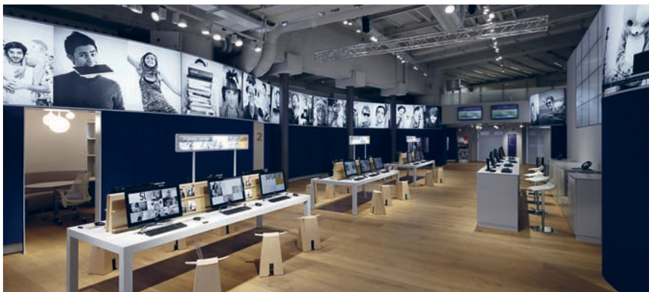
Interiors winner: Filiale bancaria Superflash Intesa Sanpaolo, Milano - Michele De Lucchi (2011)

DAL 1968 RIVISTA PROFESSIONALE LEADER / SINCE 1968 LEADING PROFESSIONAL MAGAZINE